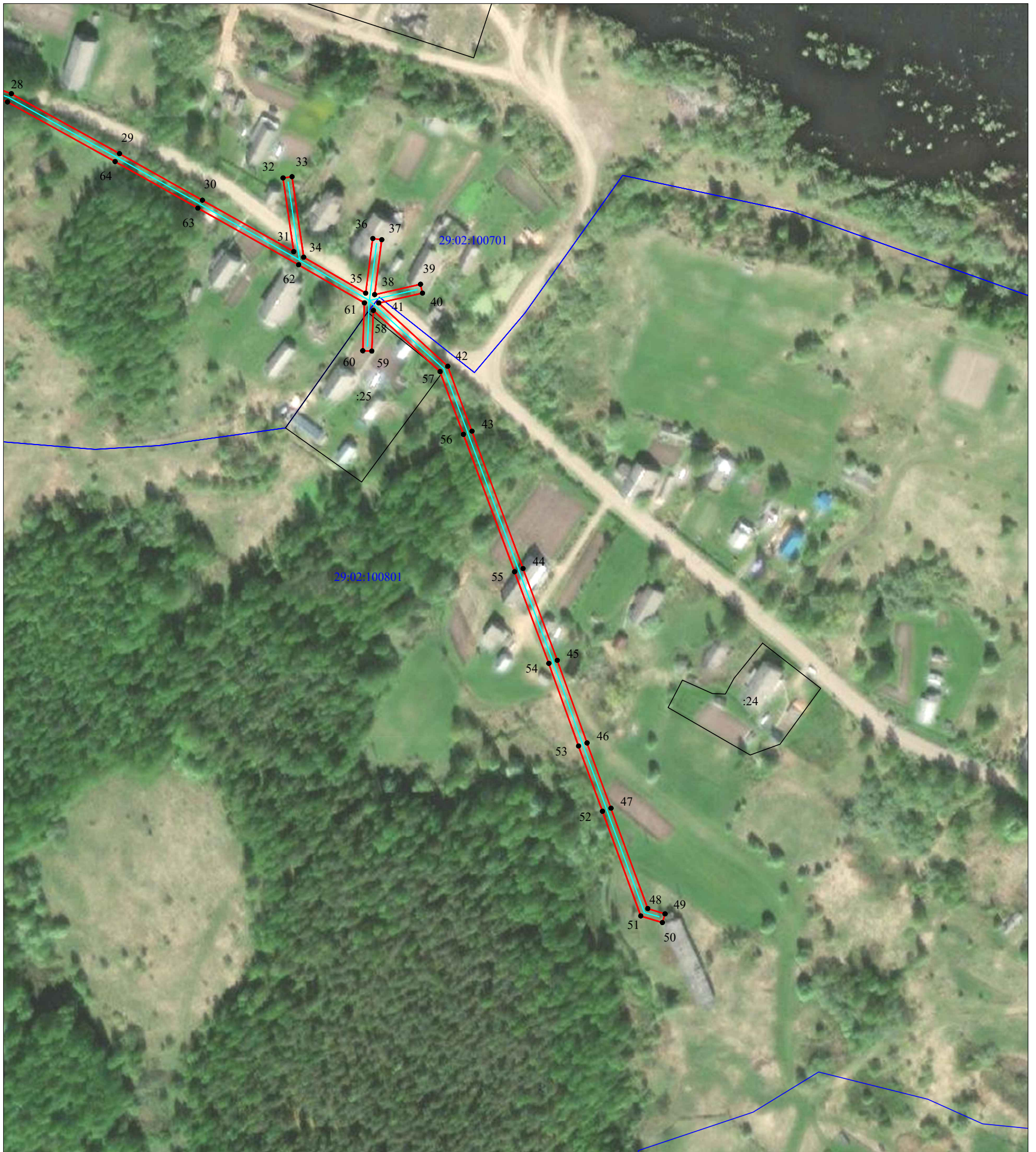
Схема расположения границ публичного сервитута объекта электросетевого хозяйства: «ВЛ-0,4кВ Нестеревская», расположенного по адресу: Архангельская область, Верхнетоемский район