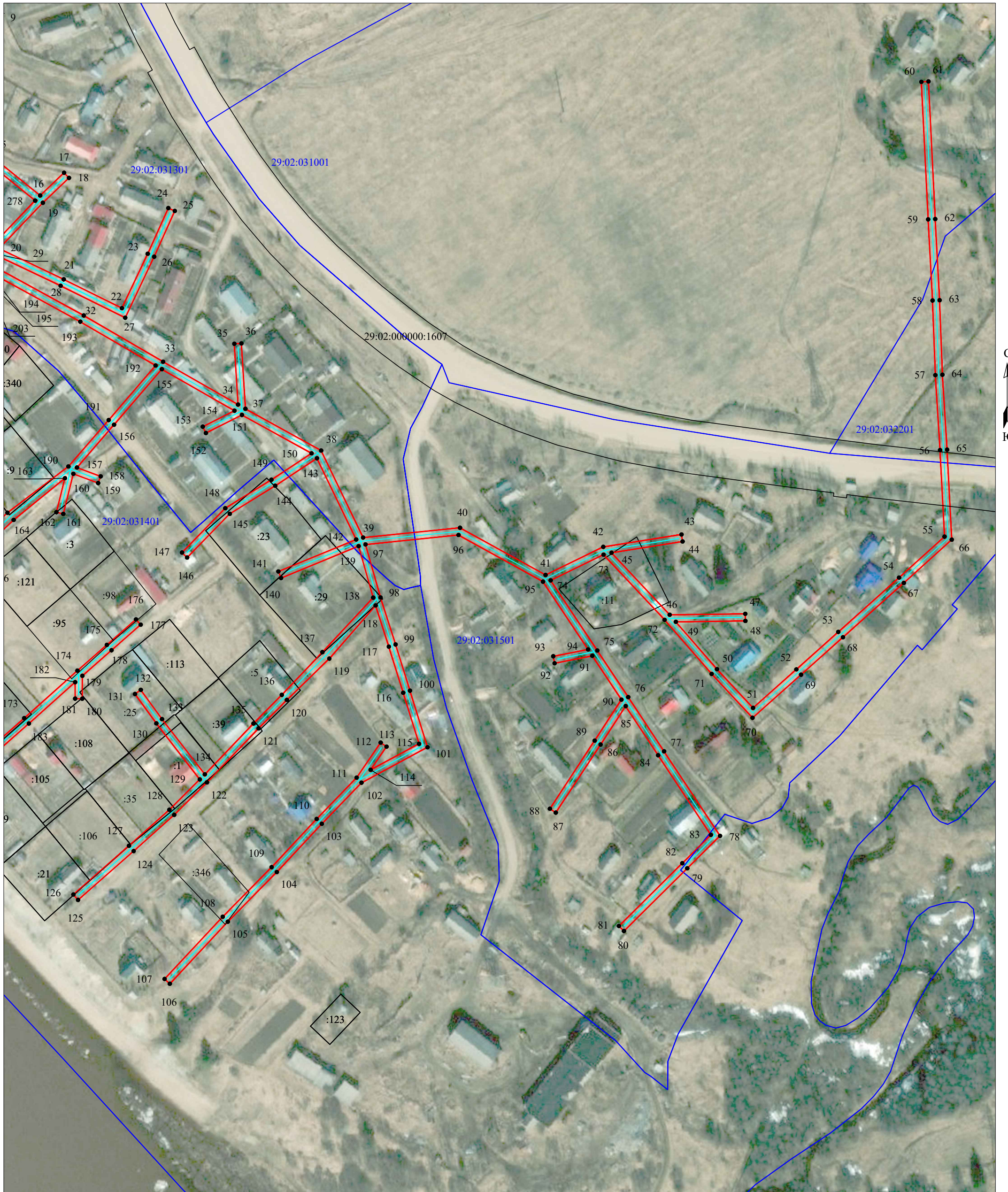
Схема расположения границ публичного сервитута объекта электросетевого хозяйства: «ВЛ-0,4кВ от КТП Малетинская», расположенного по адресу: Архангельская область, Верхнетоемский район