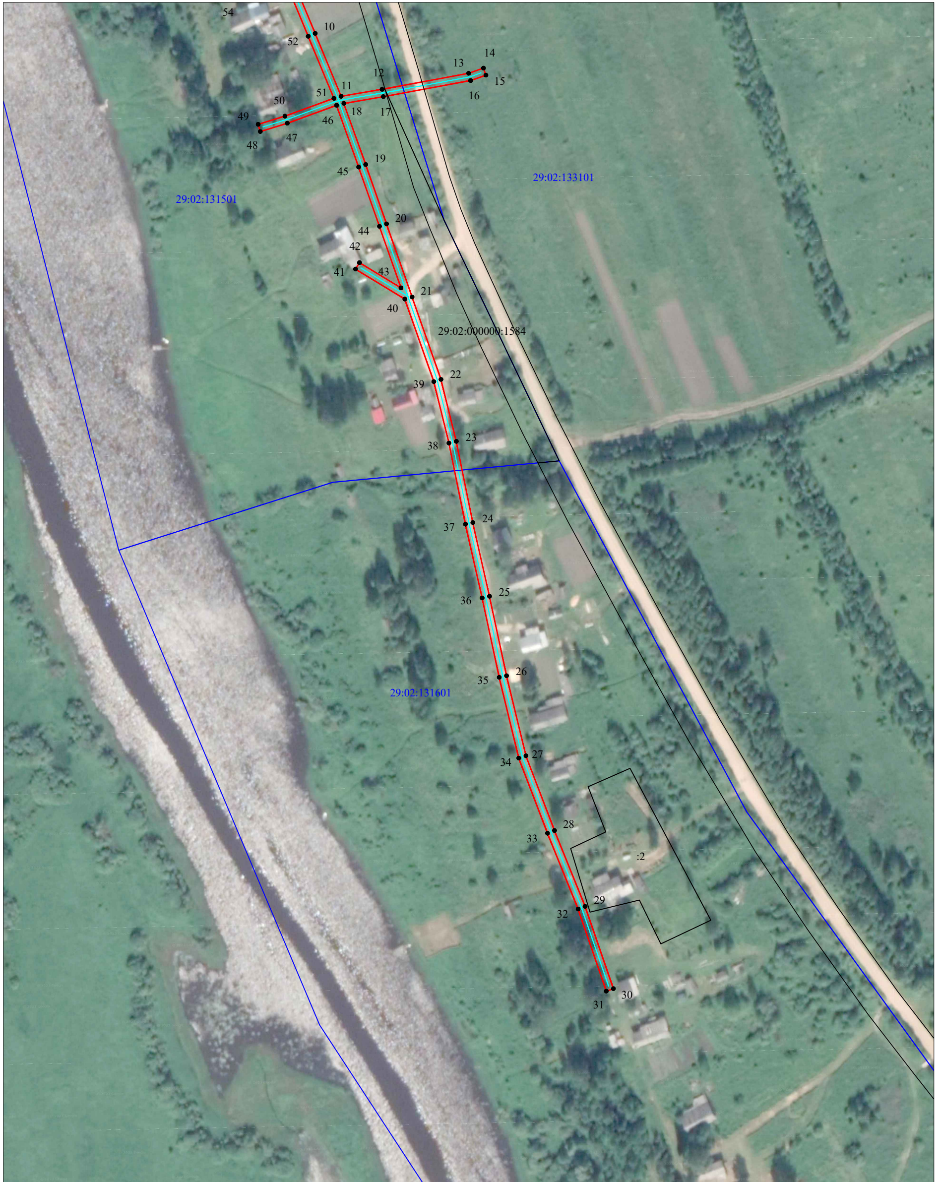
Схема расположения границ публичного сервитута объекта электросетевого хозяйства: «ВЛ-0,4кВ Баинская», расположенного по адресу: Архангельская область, Верхнетоемский район