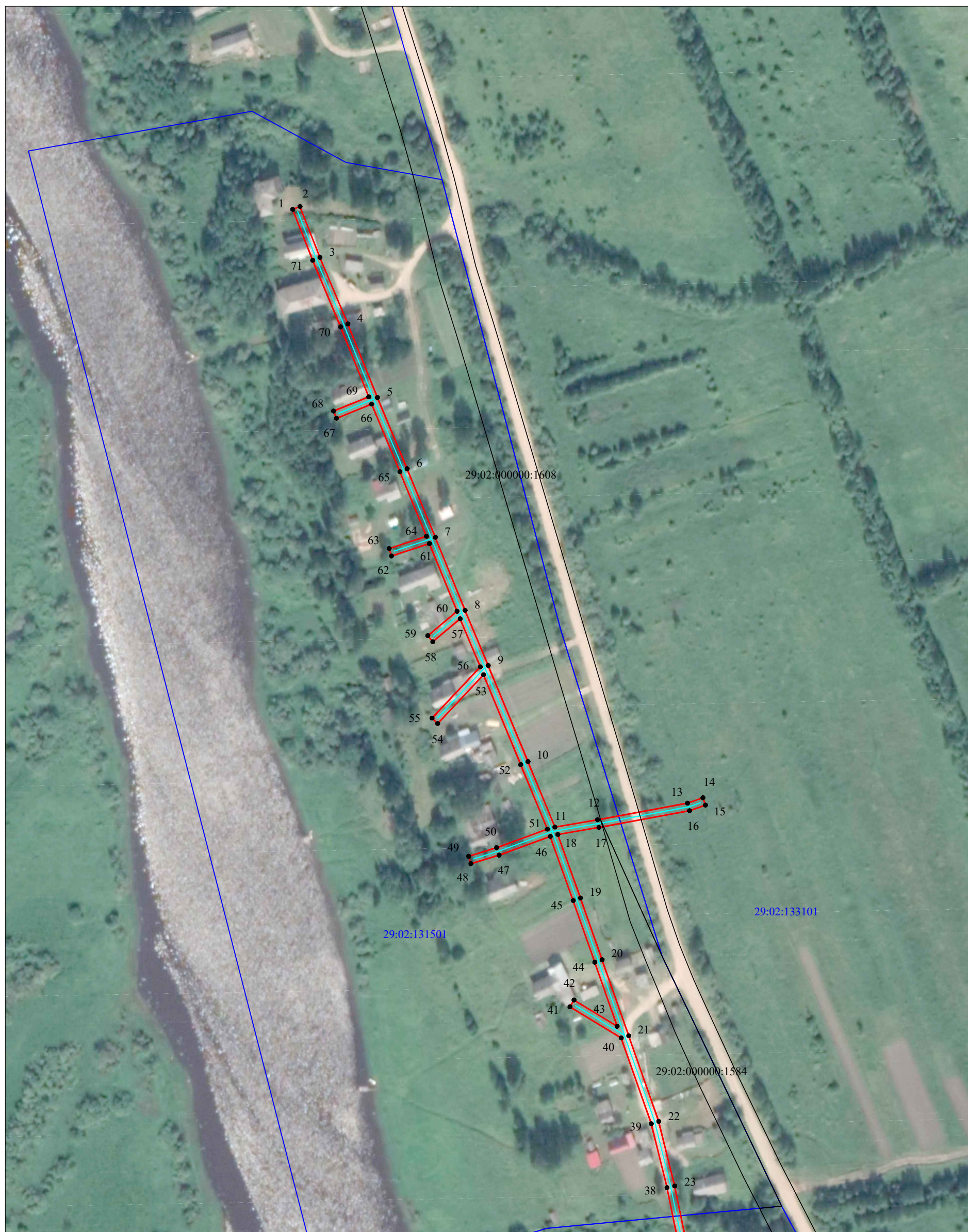
Схема расположения границ публичного сервитута объекта электросетевого хозяйства: «ВЛ-0,4кВ Баинская», расположенного по адресу: Архангельская область, Верхнетоемский район