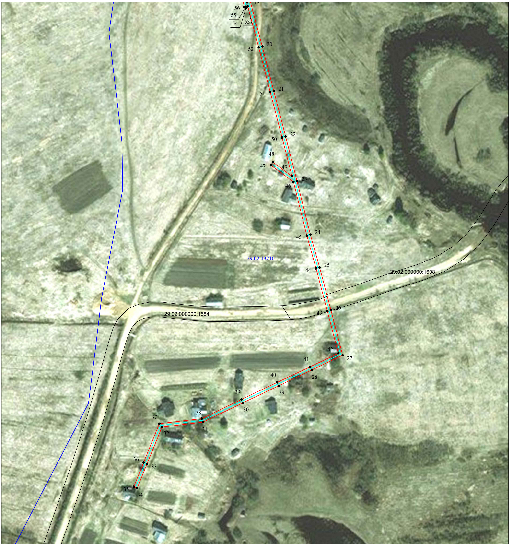
Схема расположения границ публичного сервитута объекта электросетевого хозяйства: «ВЛ-0,4кВ Анфимовская», расположенного по адресу: Архангельская область, Верхнетоемский район