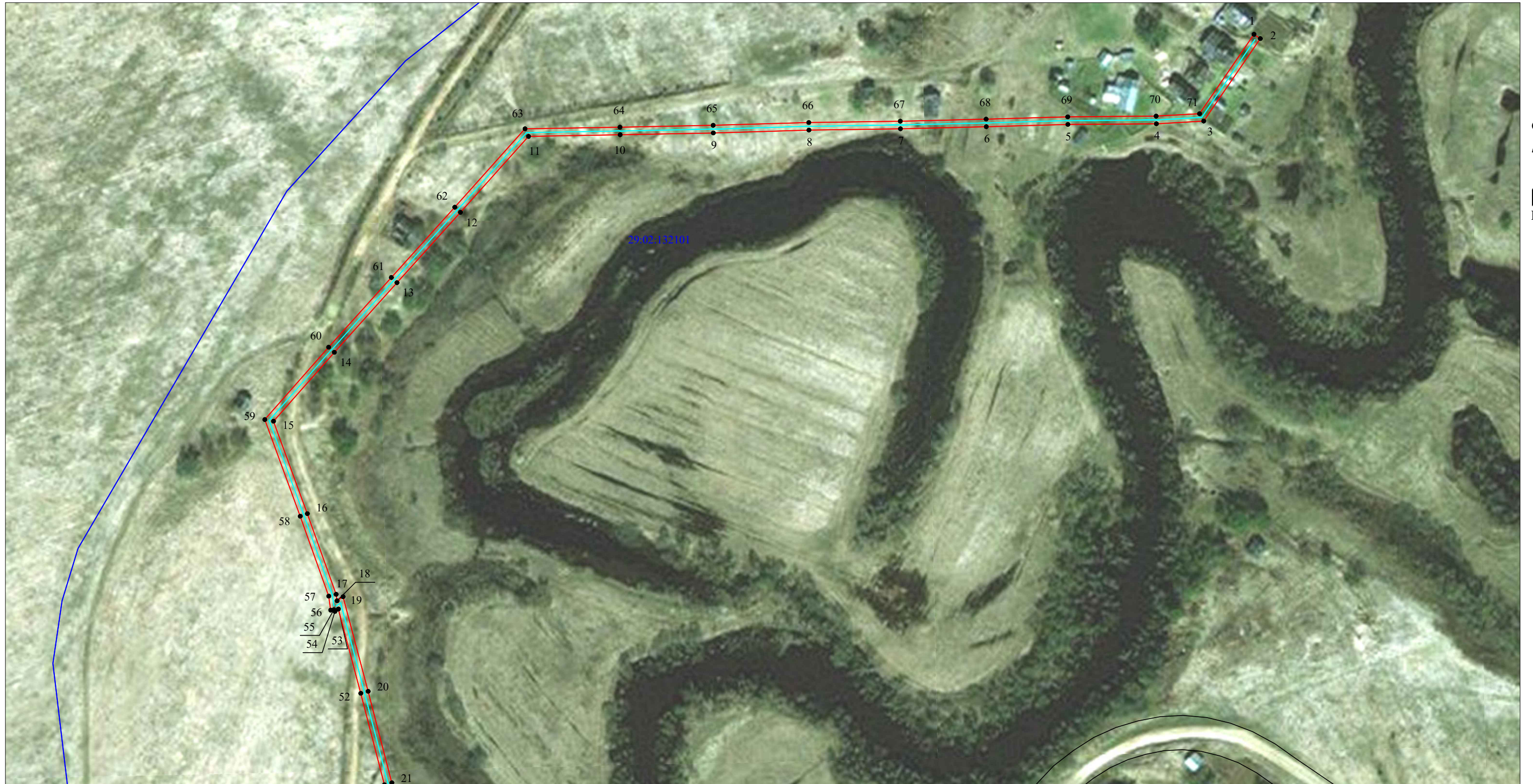
Схема расположения границ публичного сервитута объекта электросетевого хозяйства: «ВЛ-0,4кВ Анфимовская», расположенного по адресу: Архангельская область, Верхнетоемский район