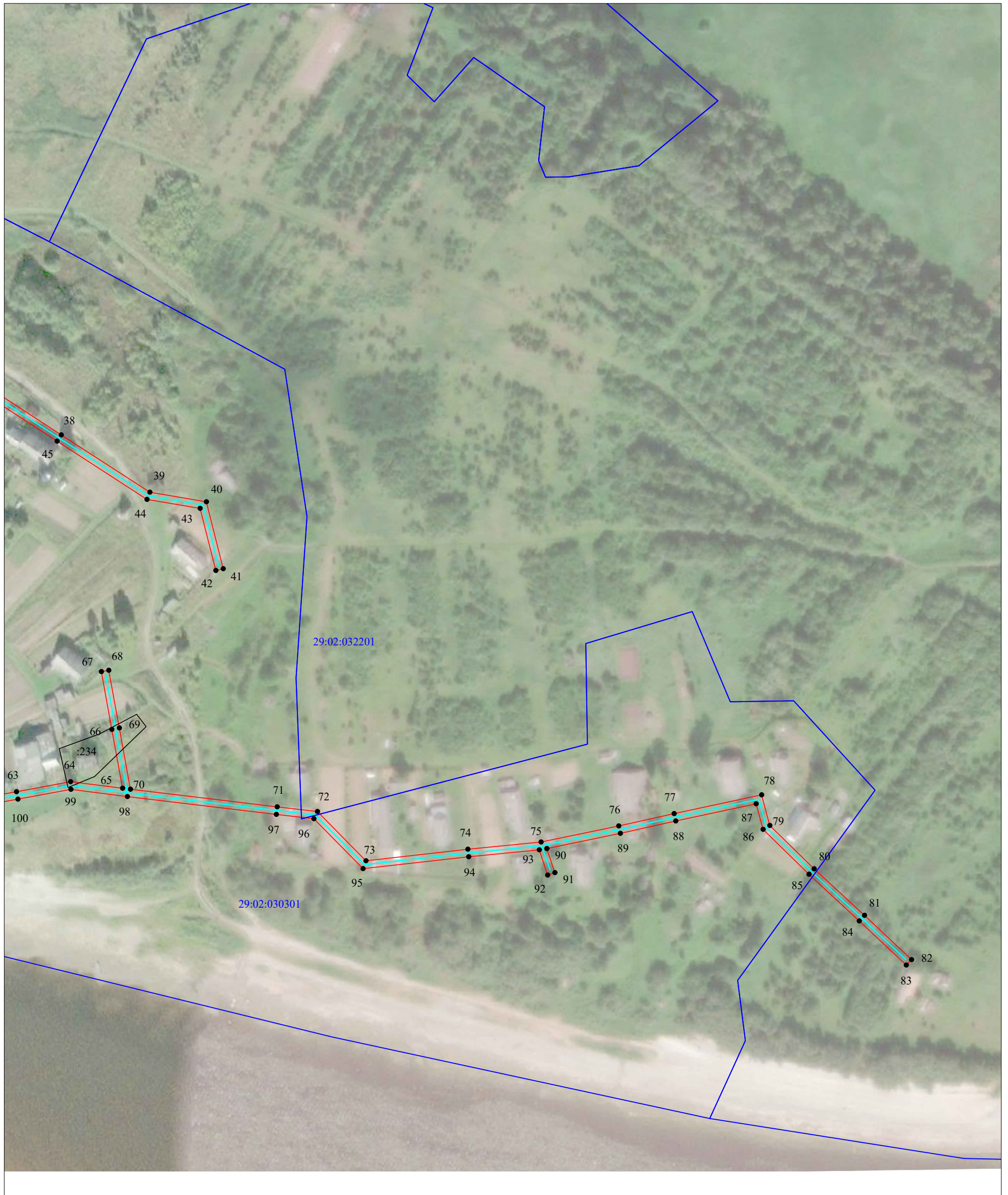
Схема расположения границ публичного сервитута объекта электросетевого хозяйства: «ВЛ-0,4кВ Волочек», расположенного по адресу: Архангельская область, Верхнетоемский район